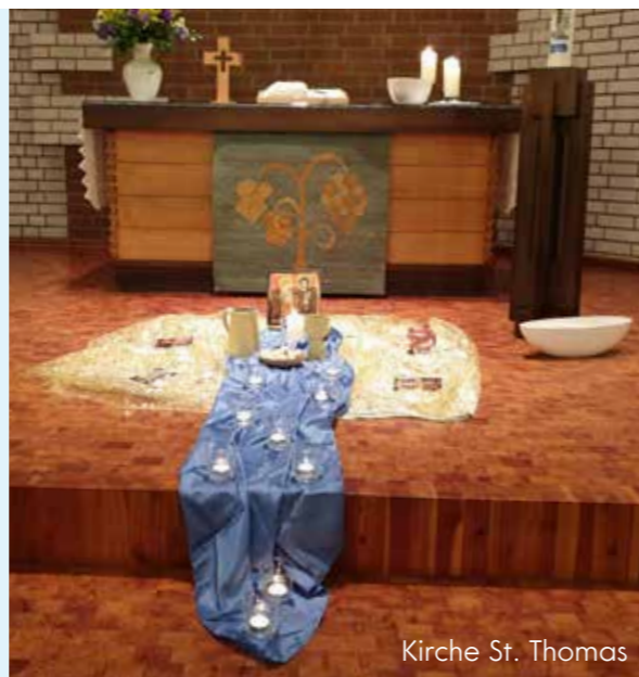
Kirche St. Thomas