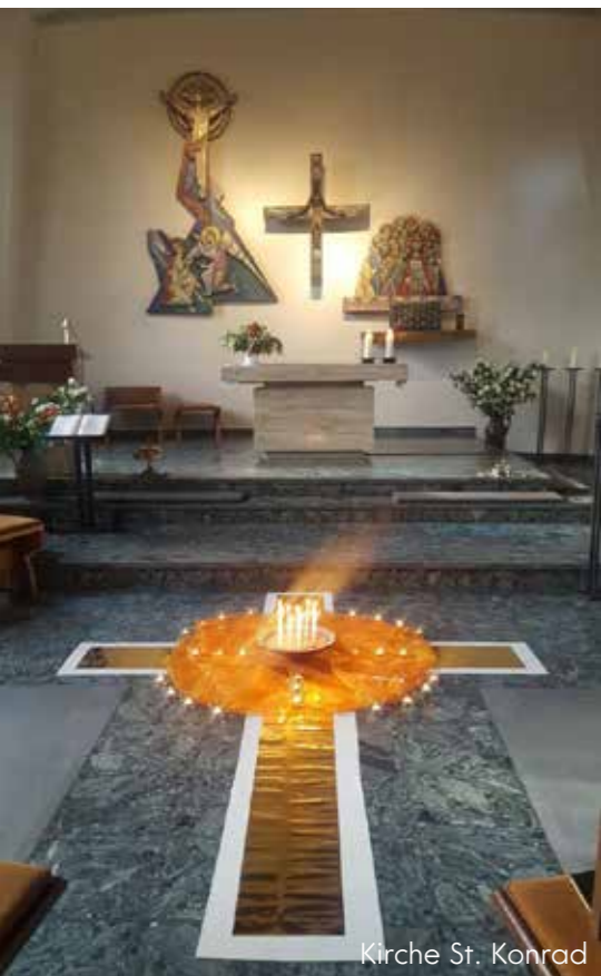
Kirche St. Konrad

Die nächsten Taizé- Gottesdienste 21.12.2019 in der Maria-Magdalena-Kirche (MMK), 18. Januar 2020 MMK, 15. Februar 2020 Kirche St. Konrad, 21. März 2020 MMK.